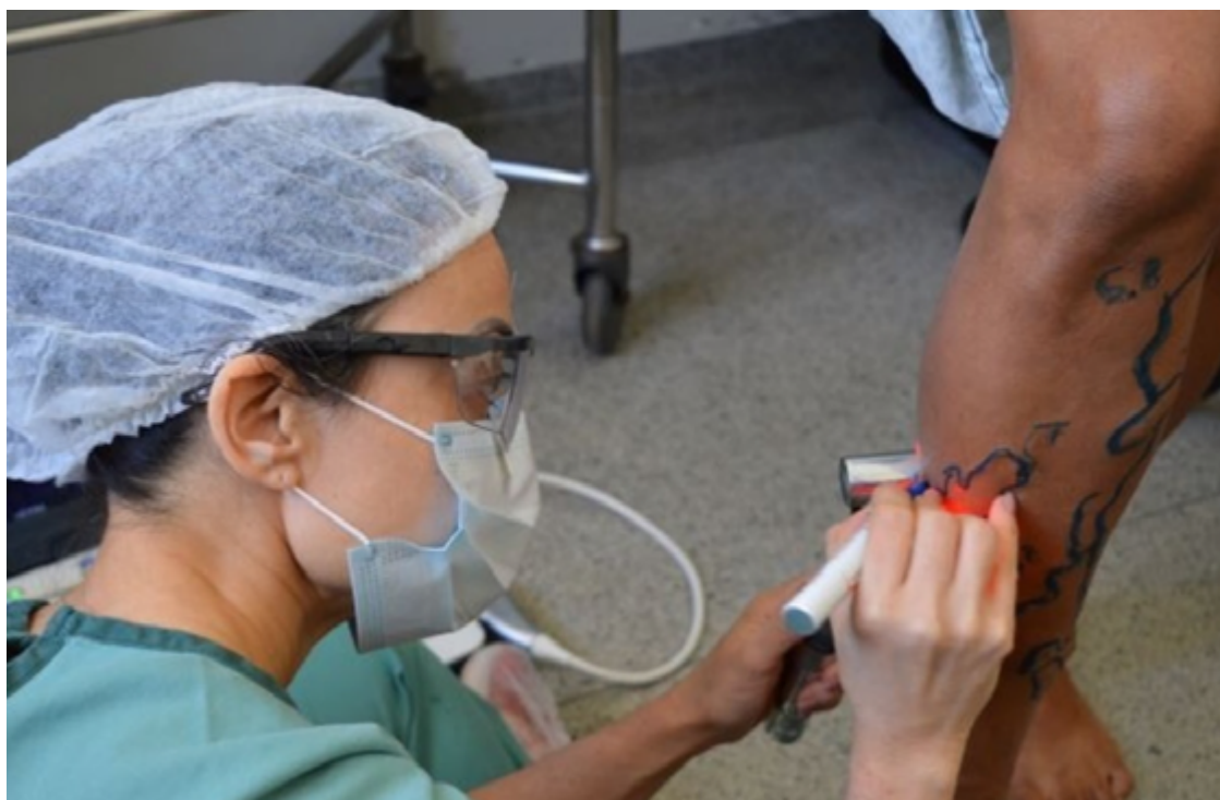
Equipe do Hetrin realiza procedimento de cirurgia vascular por Endolaser durante Mutirão de Cirurgias Eletivas

O Mutirão de Cirurgias Eletivas do Hetrin, unidade administrada pelo Instituto de Medicina, Estudos e Desenvolvimento (IMED), é uma iniciativa que visa reduzir as filas de espera para cirurgias eletivas em Goiás. O Mutirão beneficia a população de Trindade e re-