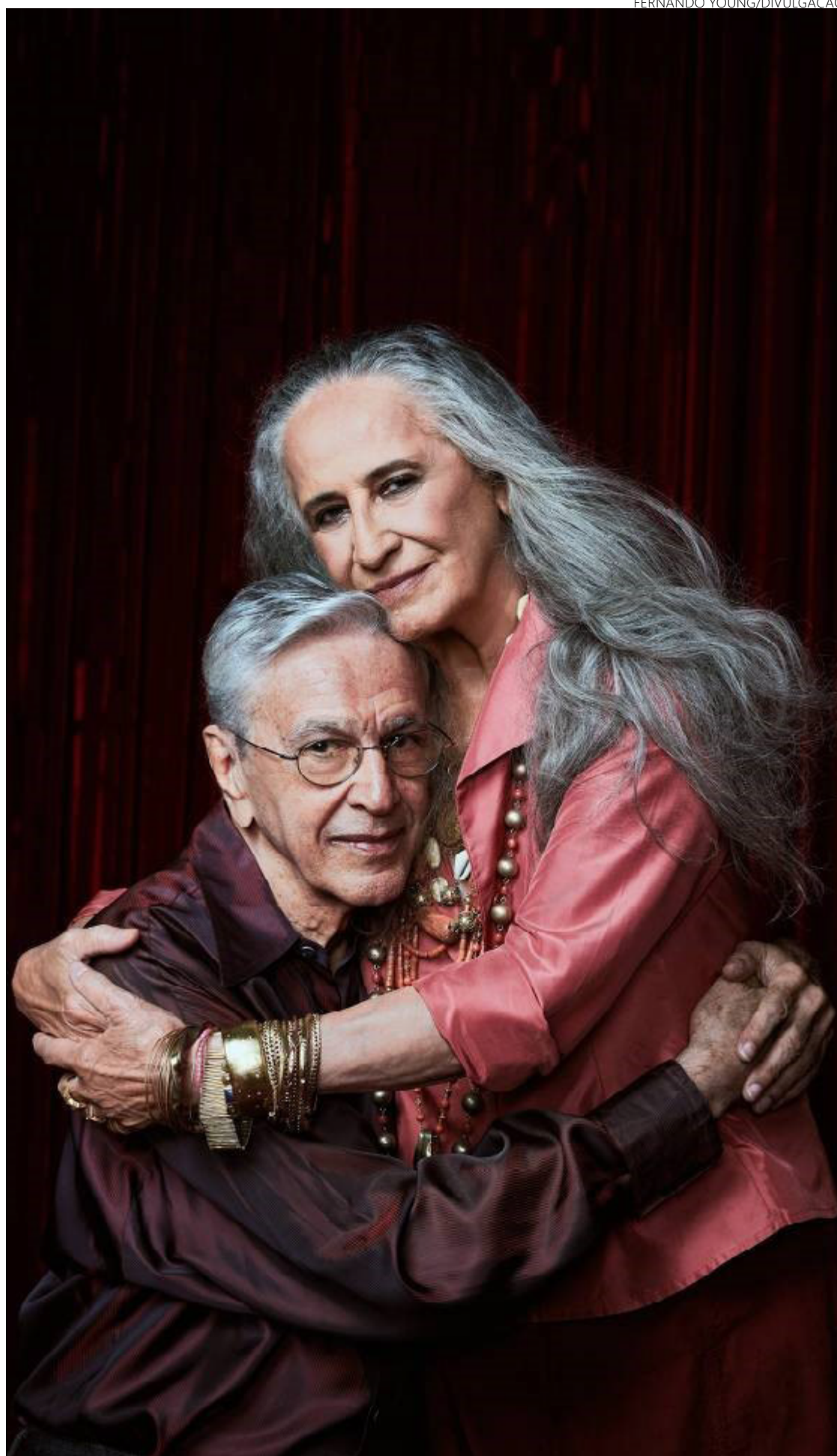
Caetano e Bethânia: Brasília deve esperar viagem por seis décadas de música popular

Interessante perceber que, aos 82 anos, Caetano ainda é capaz de surpreender e provocar incômodo no público num show em que não havia a menor expectativa de desconforto, apenas de celebração. Ele também sabe ser careta, afinal, como disse em outra das canções presentes no repertório. Canção que, importante notar, conclui pedindo à vaca profana — portanto, sagrada ao avesso — que despeje chu-