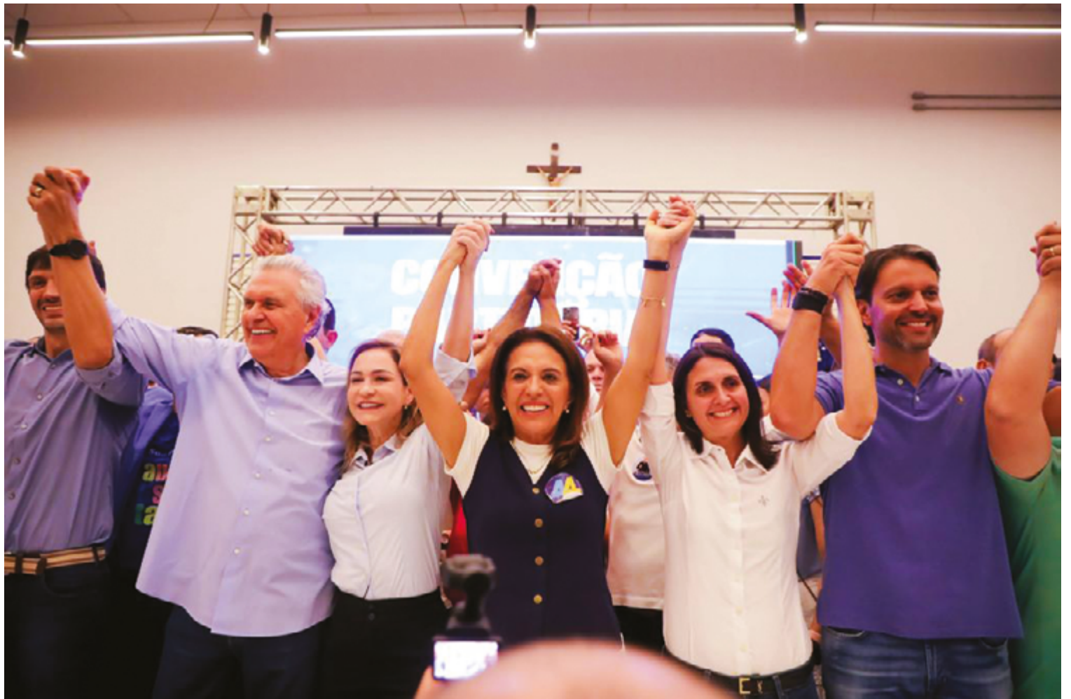
Ronaldo Caiado foi eloquente durante a convenção do União Brasil, em Anápolis; informa que vai buscar o apoio daqueles que aprovam sua gestão

Qual será o comportamento do governador daqui para