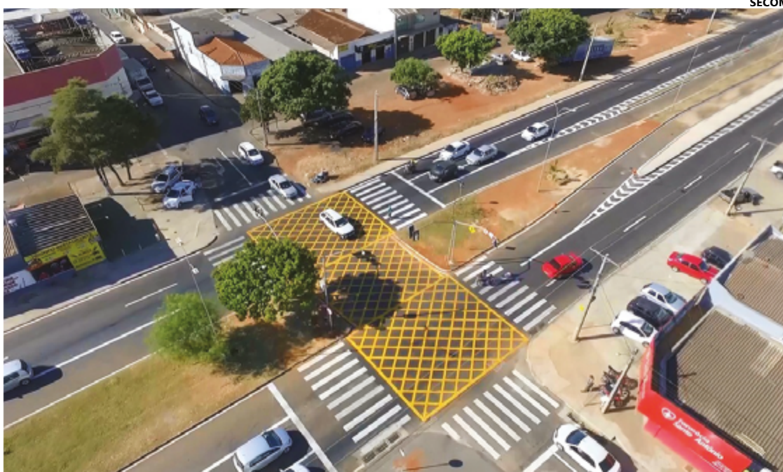
Implantação dos novos equipamentos de sinalização atendem à estratégia de se criar uma cidade inteligente

“A estrutura é extremamente mais robusta, mais moderna, ele é um totem treliçado, ou seja, ele tem uma resistência muito maior do que os anteriores, os anteriores eram só uma casquinha, uma capinha de ACM que envolvia ele, e por dentro era um tubo normal como os outros, então, veículos colidiam e acabava pendendo e caindo em caso de ocorrência de colisão, ou também quando caminhão passa e bate. Esses não, eles são extremamente robustos, são treliçados, uma estrutura metálica muito reforçada”, disse sobre os novos