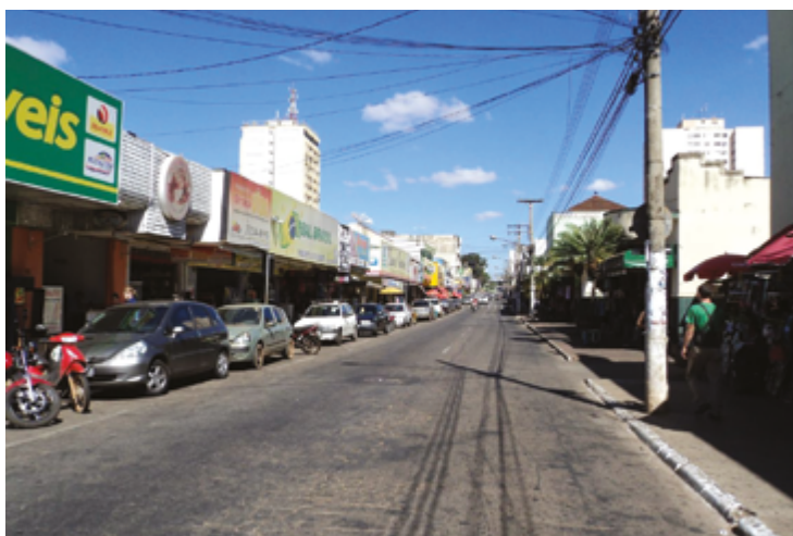
Grande salto: pelo menos 67.140 mil empresas foram abertas em Anápolis

Goiás também continua na liderança de abertura de novos negócios entre todos os estados do Norte, Nordeste e