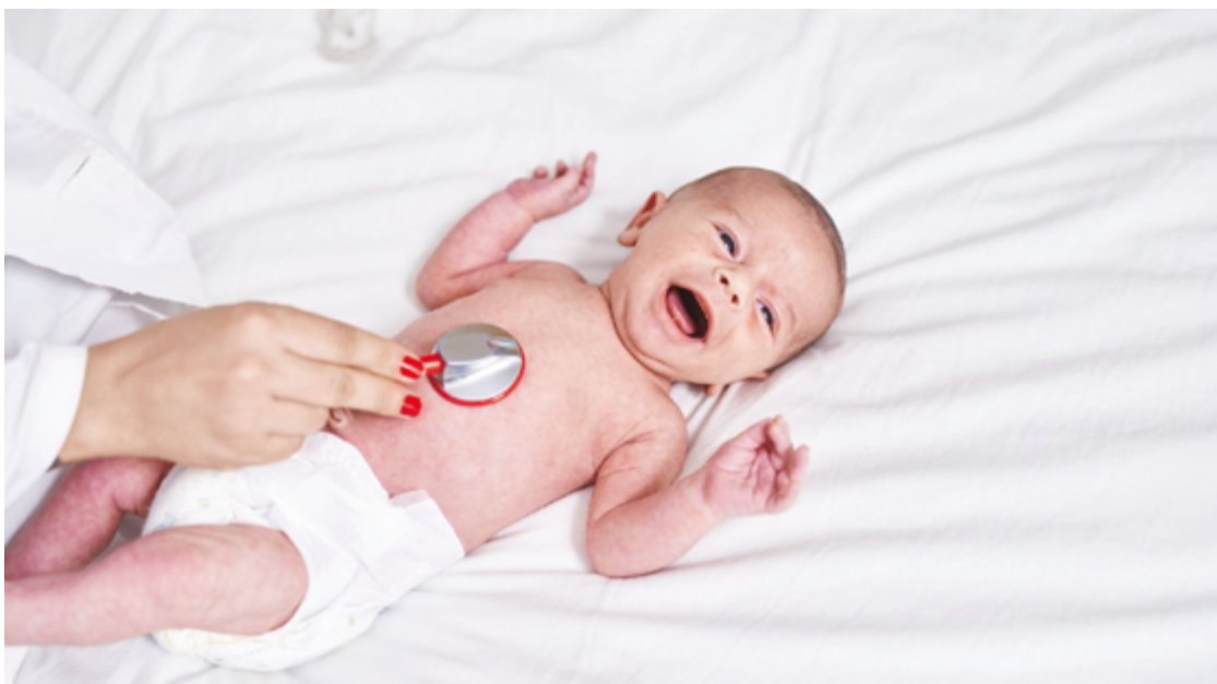
Doença é uma anomalia na estrutura ou função do coração que surgem durante o desenvolvimento fetal